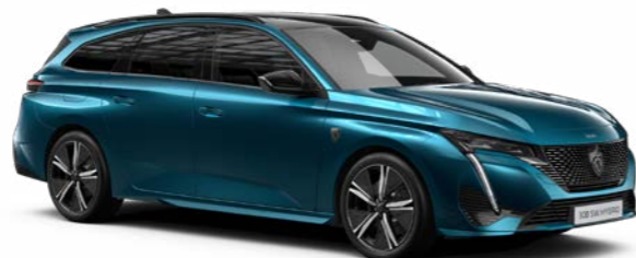
アバター・ブルー