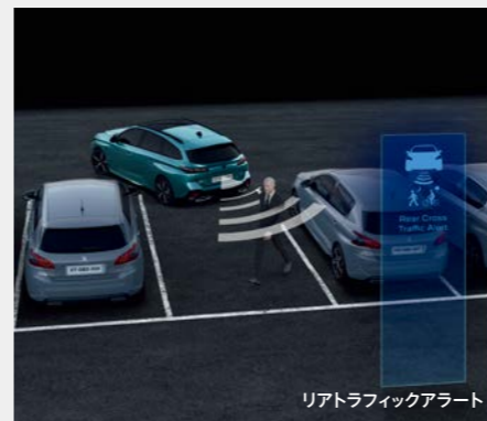
リアトラフィックアラート