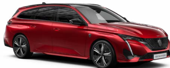
エリクサー・レッド