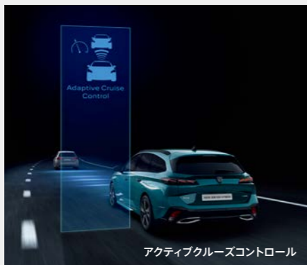
アクティブクルーズコントロール