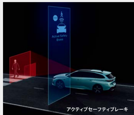
アクティブセーフティブレーキ