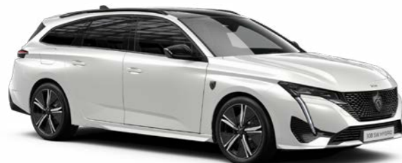
パール・ホワイト