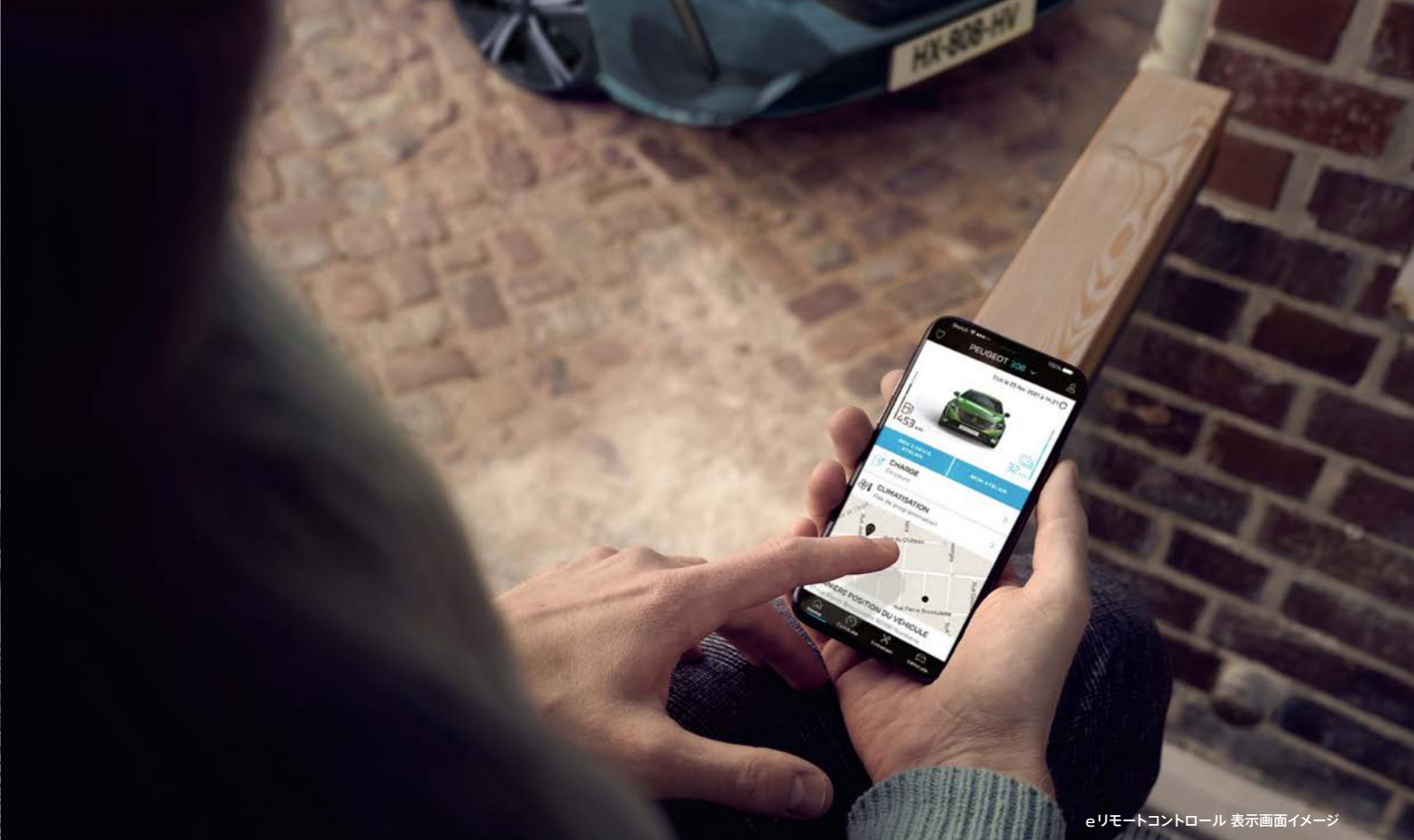
eリモートコントロール 表示画面イメージ