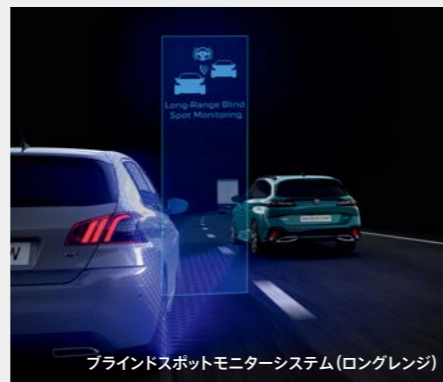
ブラインドスポットモニターシステム(ロングレンジ)