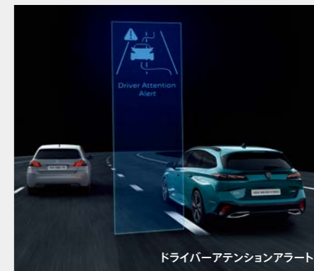
ドライバーアテンションアラート