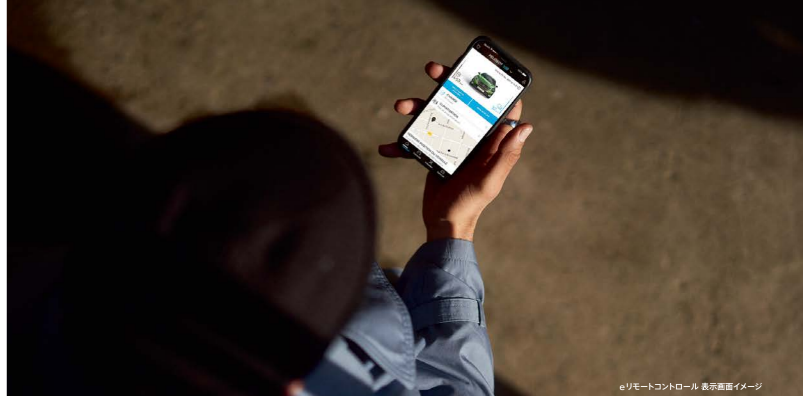
eリモートコントロール 表示画面イメージ