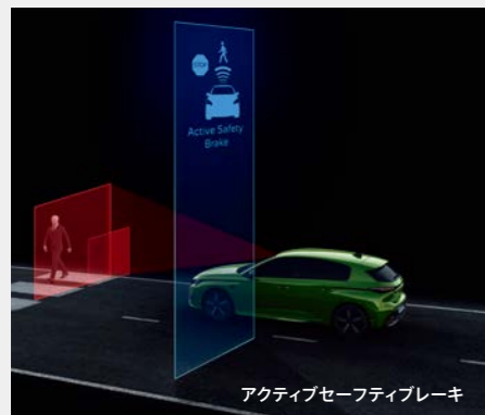
アクティブセーフティブレーキ