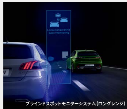
ブラインドスポットモニターシステム(ロングレンジ)