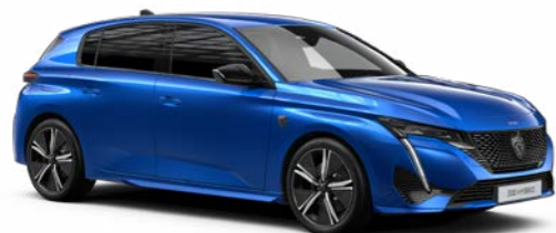
ヴァーティゴ・ブルー