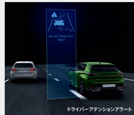
ドライバーアテンションアラート