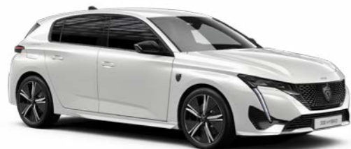
パール・ホワイト