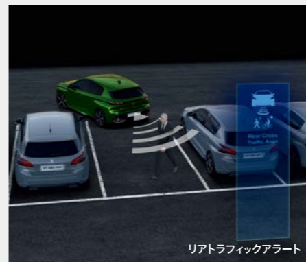
リアトラフィックアラート