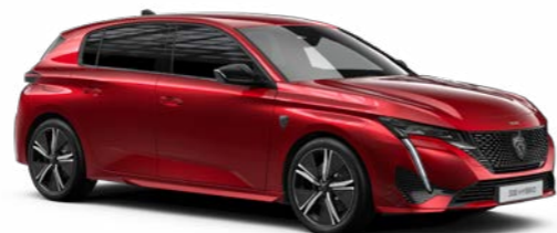
エリクサー・レッド