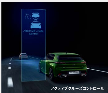
アクティブクルーズコントロール